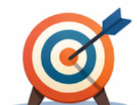
Orientarsi al futuro